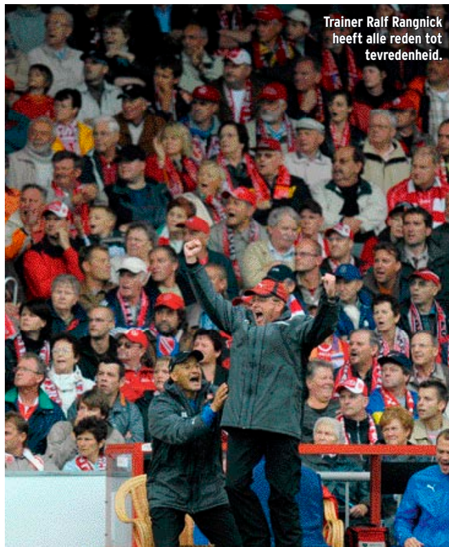
Trainer Ralf Rangnick heeft alle reden tot tevredenheid.