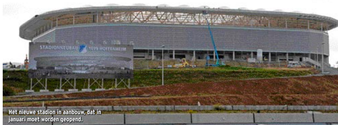
Het nieuwe stadion in aanbouw, dat in januari moet worden geopend.